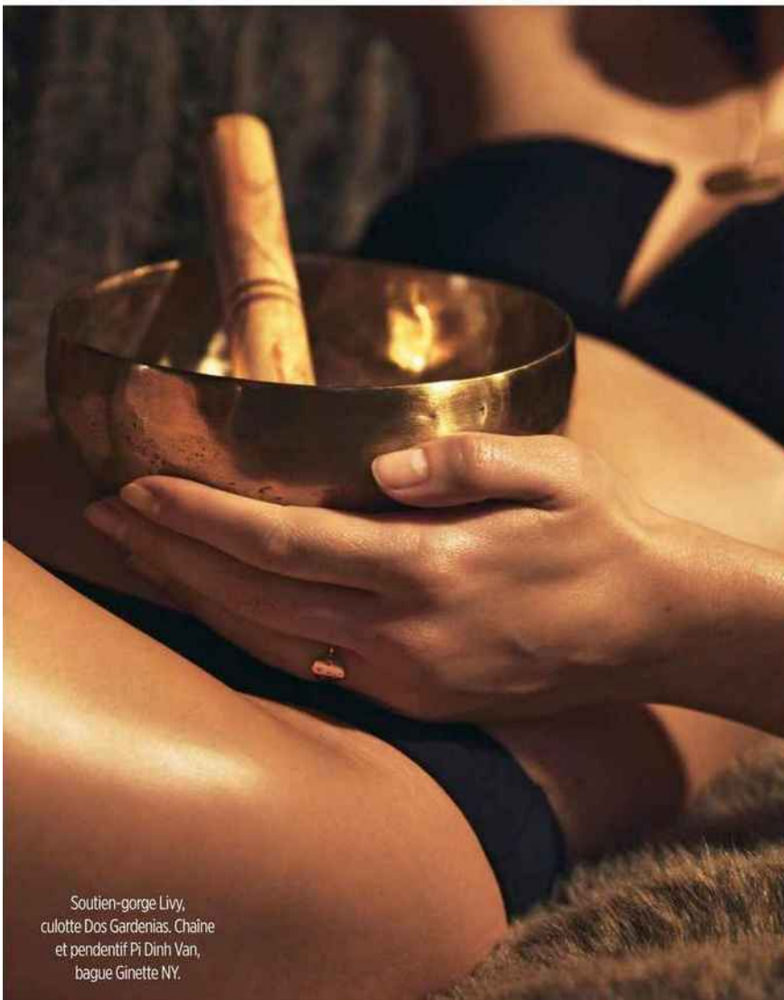
Soutien-gorge Livy, culotte Dos Gardenias. Chaîne et pendentif Pi Dinh Van, bague Ginette NY.

Savoir s'arrêter, prendre le temps de s'écouter pour mieux attaquer la nouvelle année.